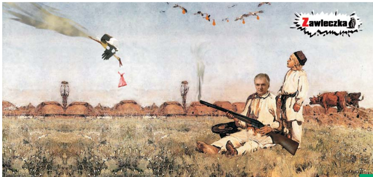
„Bociany”. Józef Chelmoński i Grupa Artystyczna „Zawlecza”. Plakat na mobilu reklamującym warszawską Manifę 2009

Agnieszka Graff – pisarka, tłumaczka i publicystka związana z ruchem feministycznym. Autorka Świata bez kobiet (2001). Członkini zespołu „Krytyki Politycznej” i jedna z założycielek partii Zielonych.